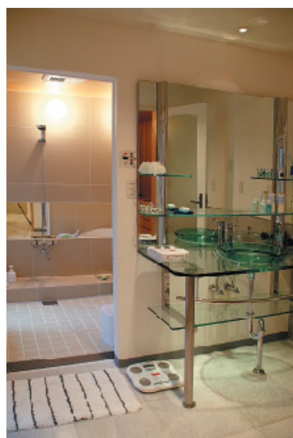
(左)ゾート感覚のバスコート、浴室と寝室の両方から出られます (中)浴室と洗面所にも床暖房。隣にはサウナがあります (右)Beハウスガーデンシティ湖南モデルハウス 050-5525-9071 定休日/毎週水曜 第1第3火曜