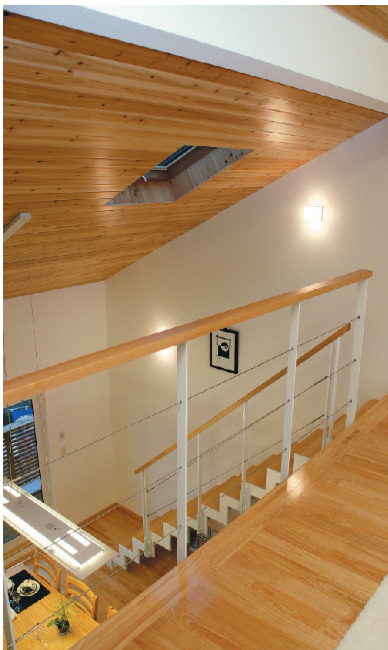
勾配天井による高い吹き抜けが、ロフトとLDKを一体化させ、開放感を生んでいます