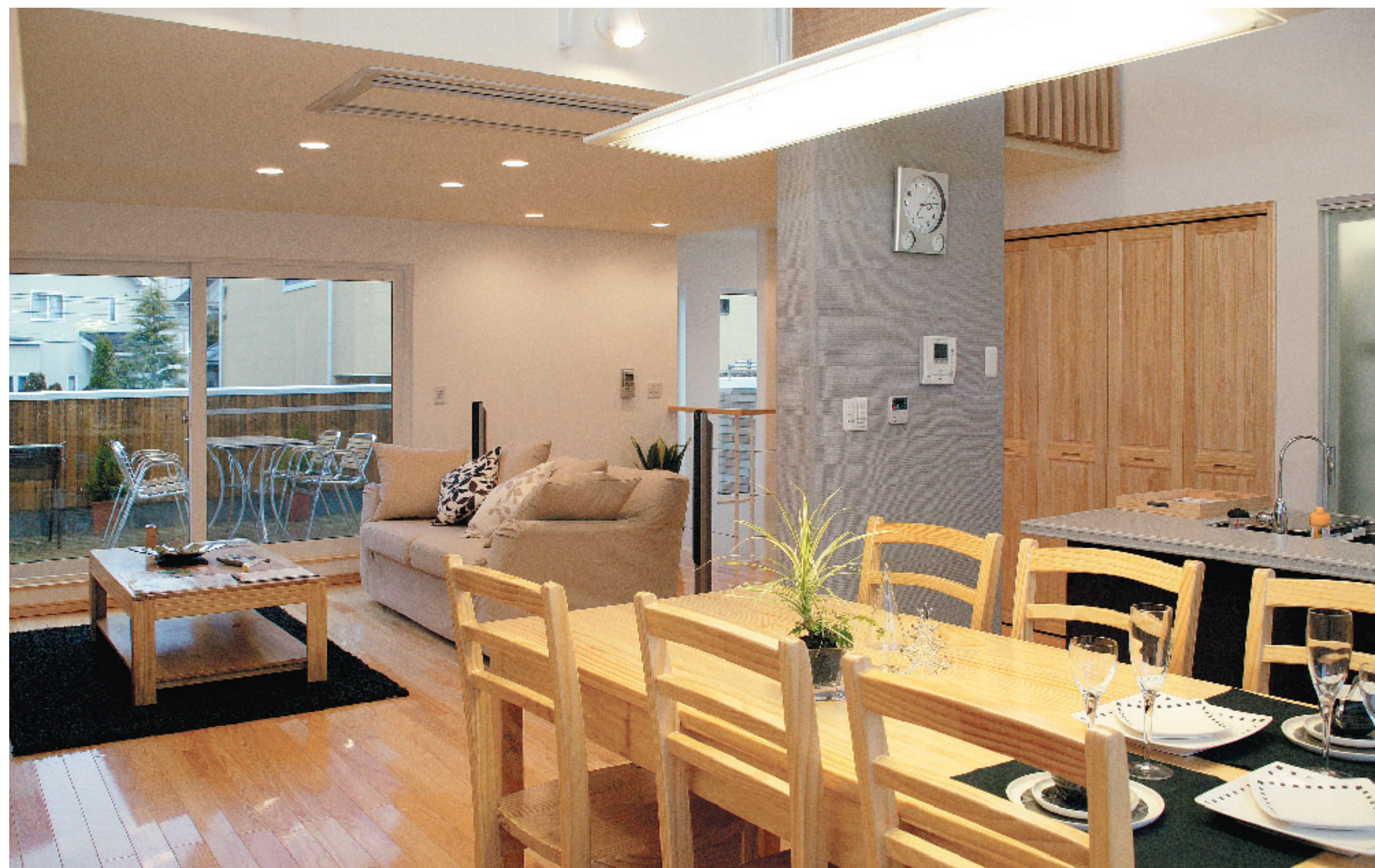
オープンスタイルのLDK。北側のバルコニーがウッドデッキの役割を果たし、リビングに明るさと広がりを与えています